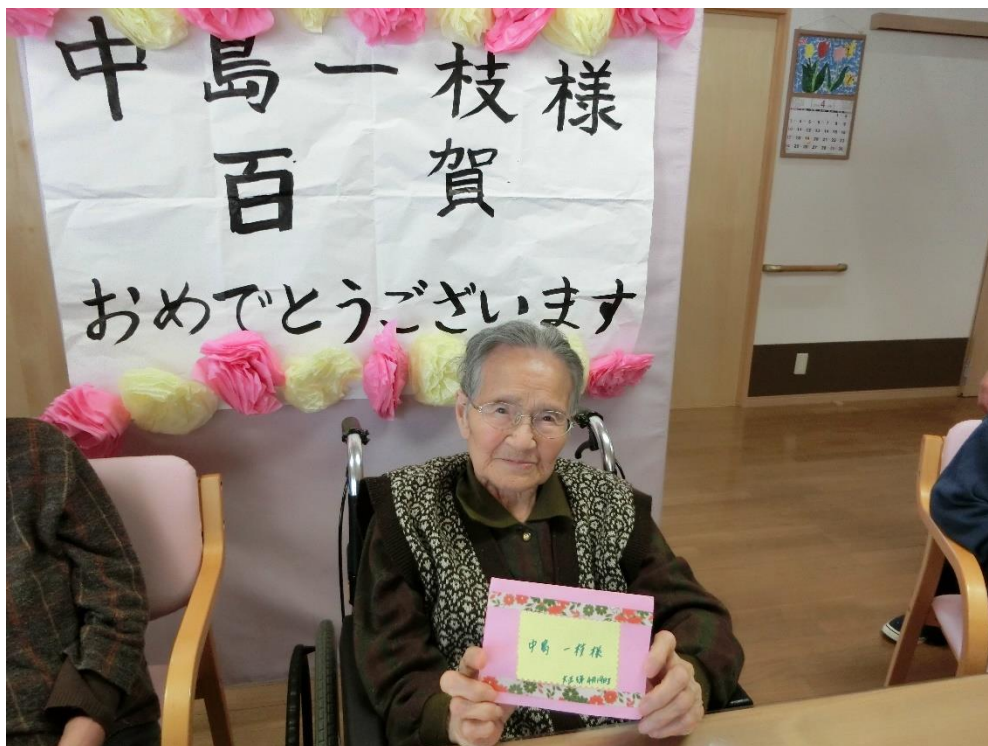
お誕生日おめでとうございます。100歳になりました🎂