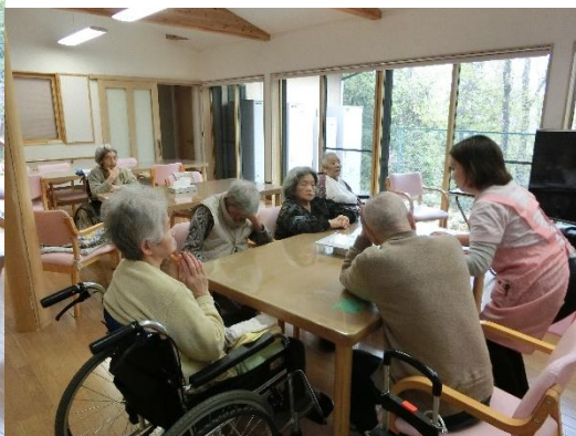
しりとりが始まりました。“ん〜っと一生懸命”考える姿見られました。