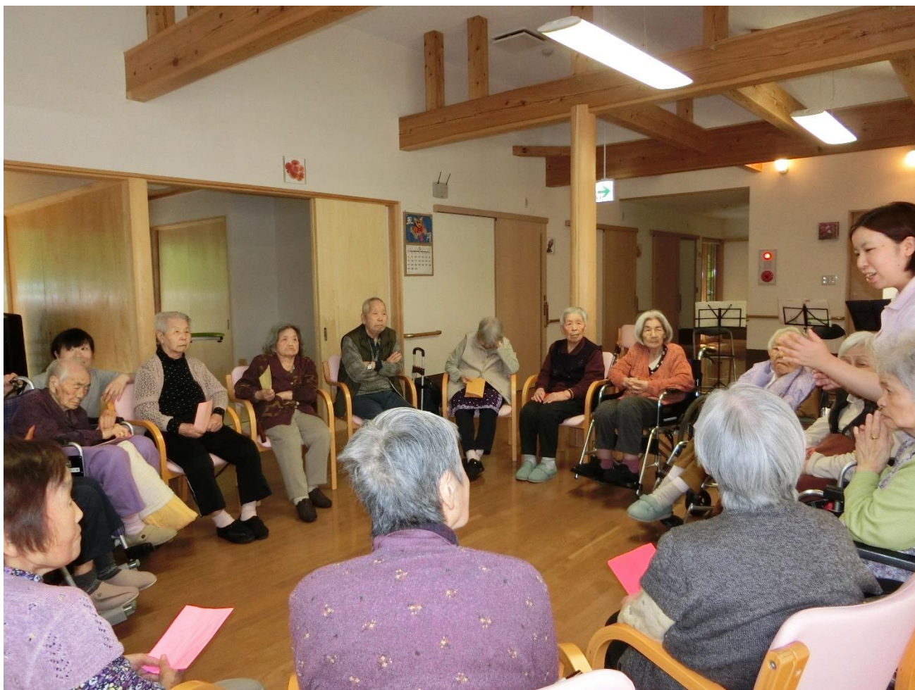
ボランティアさんと共に、鯉のぼりや花は咲く等、一緒に歌ったり、肩叩きを行いました。