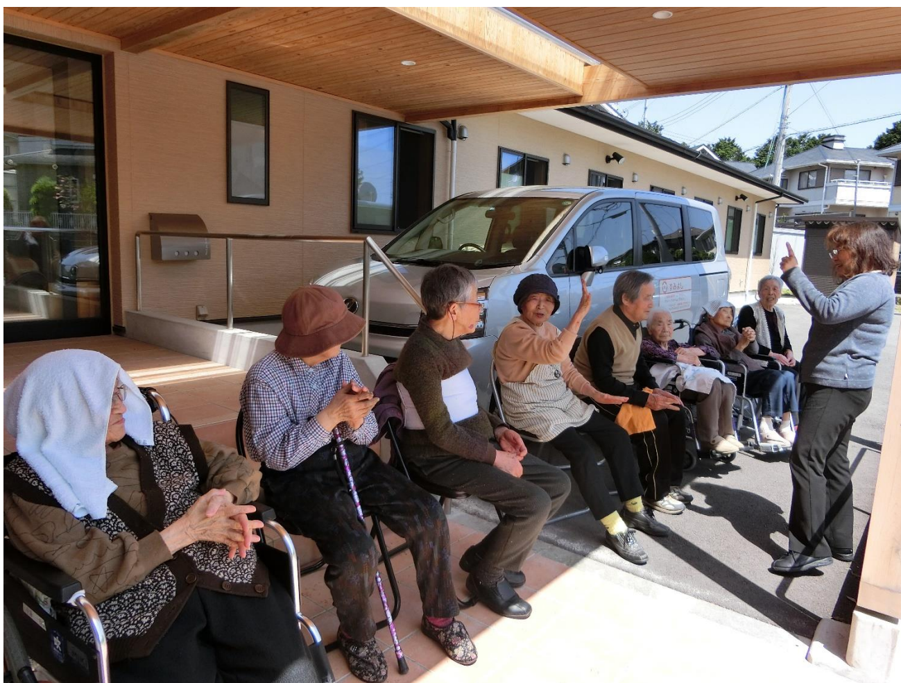
皆さ〜ん 私に勝って下さいね！いきますよ ジャンケン ホイ👊 🙌 🖐