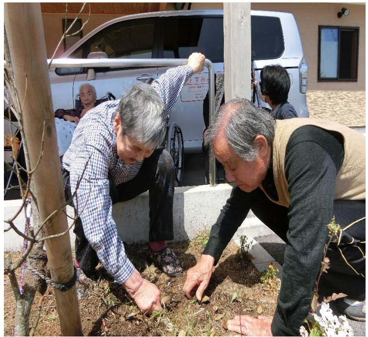
昔はよくやったのよ〜っと、思い出話で盛り上がりながら、雑草を抜かれています。